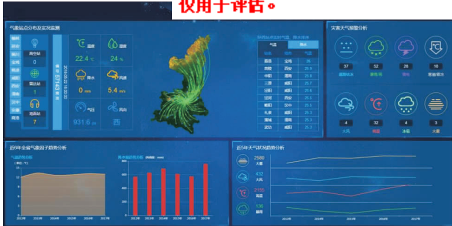
图3 “秦云工程”陕西气象云大屏展示截图